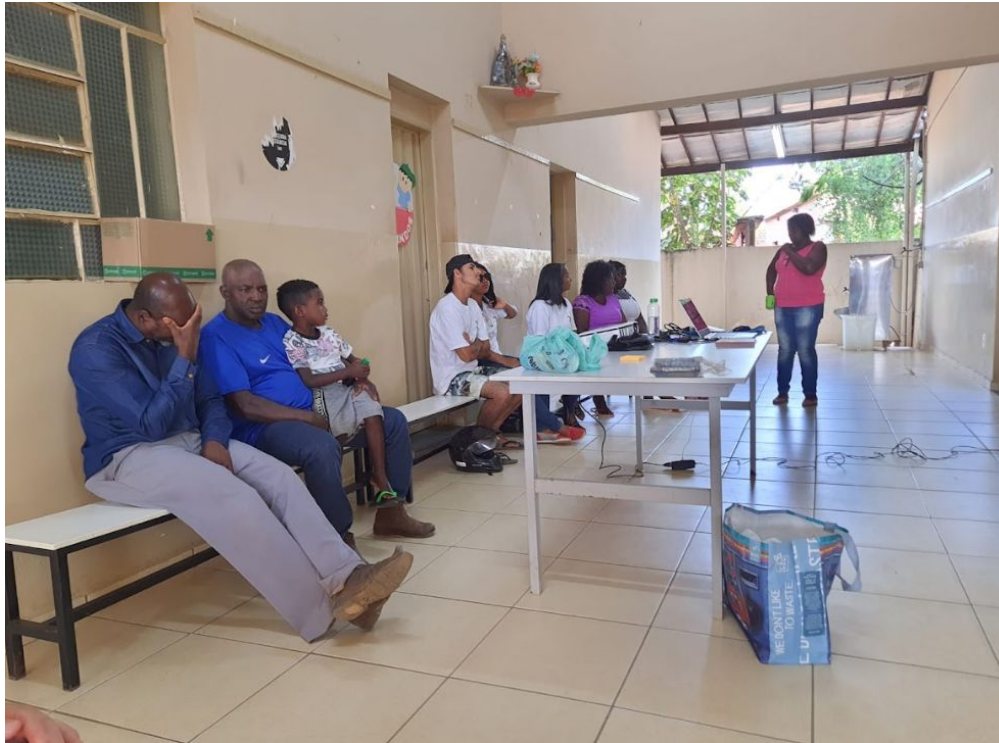
Oficinas de associativismo e planejamento organizacional (2022-2025)