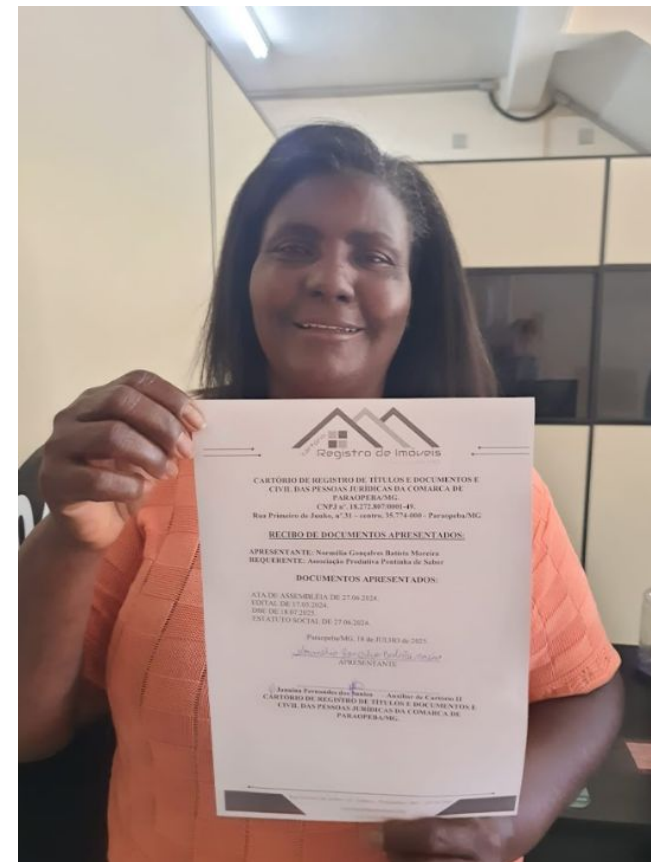
Formalização concluída com obtenção do CNPJ (2025)