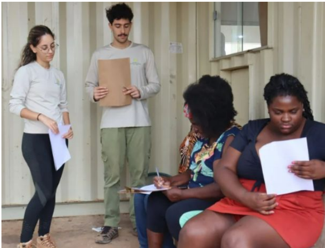
Validação coletiva do estatuto elaborado participativamente